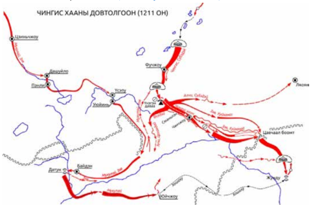
Зураг 2. Чингис хааны цэрэг анх 1211 онд ачлан дайтсан нь ( Х.Шагдар et al. 2024, т.83 ).

Чингис хаан 2011 оны хавар, аян дайн хийхээр Алтан Улсыг зорихдоо цэргээ хоёр замд хуваажээ. Зэв, Мухулай, Сүбээдэй нарын захирсан манлай цэргийг баруун зам болгов. Энэ замын цэрэг Хэрлэн голын эхээс Алаша уулын зүүн хормойгоор 800 км зам туулан Тангуд оржээ. Энэ оны 4 дүгээр сар гэхэд баруун замын цэрэг “Зүрчдийн нутагт цөмрөн Да Шюлян, Пянли-г дараалан аваад зун нь Датунд орох оньс гэгдсэн Үсэпу-г довтлов” ( Х.Шагдар et al. 2024, т.82 ).